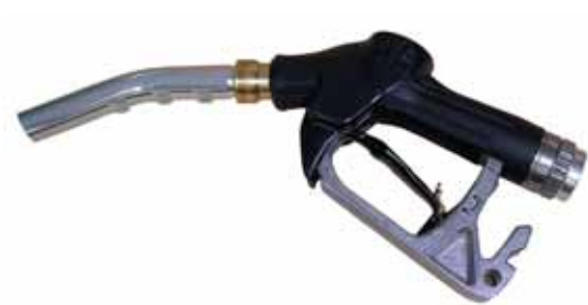
Pistolventil för bensin och diesel