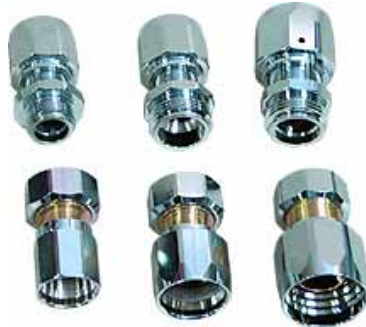
Hylskopplingar för bensin- och dieselslang